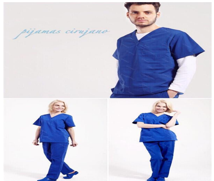
PIJAMA PARA MEDICO