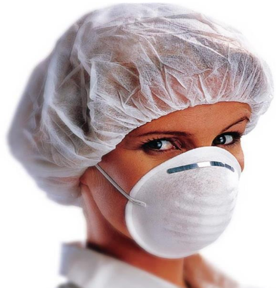
MASCARILLA BOSAL DESECHABLE