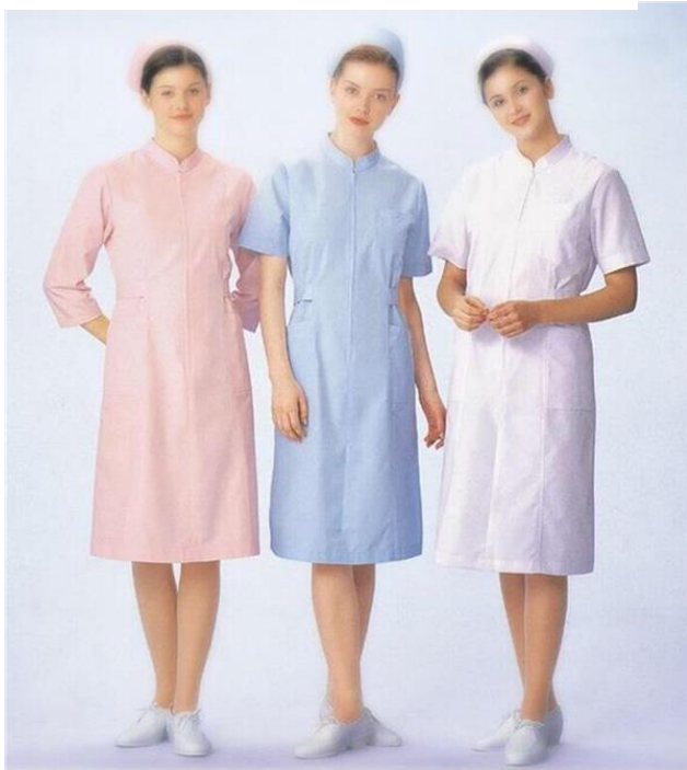
UNIFORMES DE ENFERMERAS