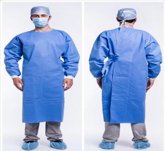
BATA DE CIRUJANO. O DE PACIENTE