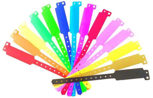
BRAZALETE IDENTIFICADOR PARA ADULTOS Y BEBE