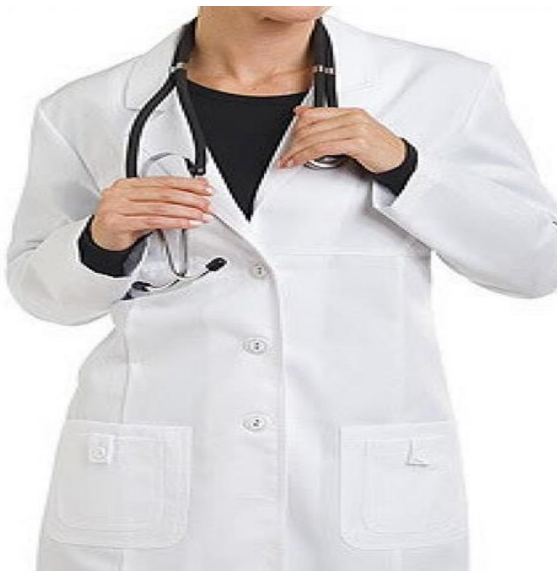
BATA PARA MEDICO