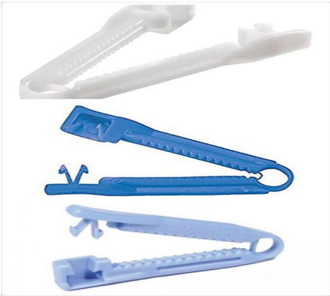
CLIP PARA OMBLIGOS DE BEBE