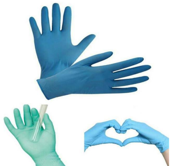
GUANTES DE EXAMEN