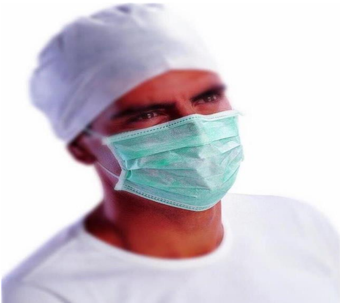
MASCARILLA DESECHABLE CON GOMA